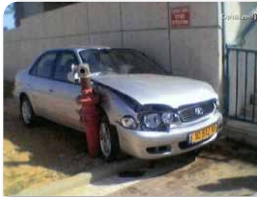
— Ово није било ту кад сам се паркирао...

Нећемо пропустити прилику да као редакција ПАРКИНГС-а свима честитамо предстојеће празнике. Желимо вам све најбоље на послу, као и много здравља и среће, вама и вашим породицама.