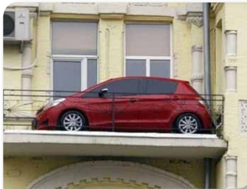
— Е, нек' ме сад однесу!