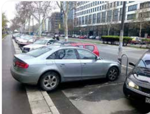
— Е, баш нећу да платим!