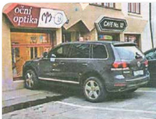
— Јао, нисам видео!